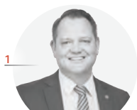
CHRISTIAN SAMWALD Landtagsabgeordneter TERNITZ